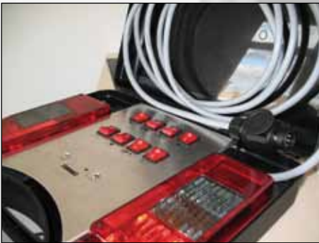
ZWT 40 Art.-Nr. 071217_1

Zur Kontrolle der Steckdose am Zugwagen. Jede Lampe ist einzeln ab-/ und zuschaltbar. Die Schalter sind im eingeschalteten Zustand beleuchtet.